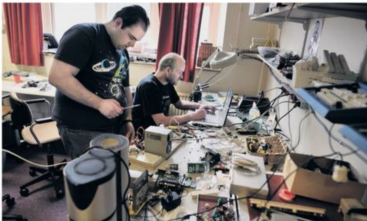
Hack42 in Arnhem hield zaterdag, net als vijf andere hackersorganisaties in Nederland, open dag. In Leeuwarden opende Frack, een stichting met vijftien officiële leden, haar deuren.

Het gaat om het klussen, het knoeien. Het resultaat doet er minder toe, net als vroeger toen ze met LEGO speelden. Dit hackerscollectief lijkt