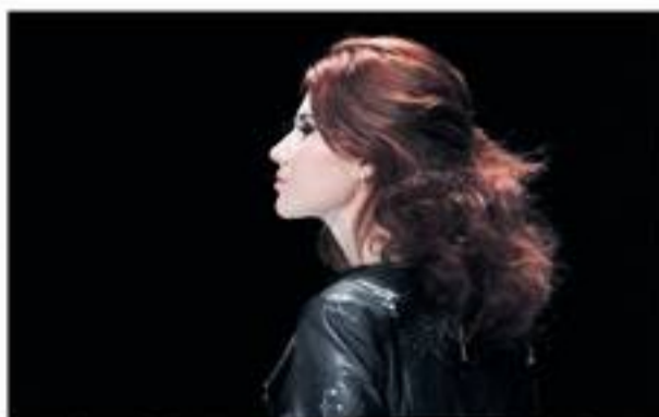
Anna Chapman tijdens een modeshow in Moskou. De Russische spionne werd na haar uitzetting uit de VS in eigen land een seksymbool.

Het OM meldde vrijdag dat een 60-jarige medewerker van het ministerie van Buitenlandse Zaken verdacht wordt van omkoping en het lekken van vertrouwelijke informatie, mogelijk staatsgeheimen, aan Rusland. Het personeel van het ministerie is schriftelijk geïnformeerd door de secretaris-generaal, de hoogste ambtenaar. Zijn mededeling over een ‘ernstige integriteitschending’ leidde tot ongelof en verbijstering op het ministerie, melden bronnen dit weekeinde.